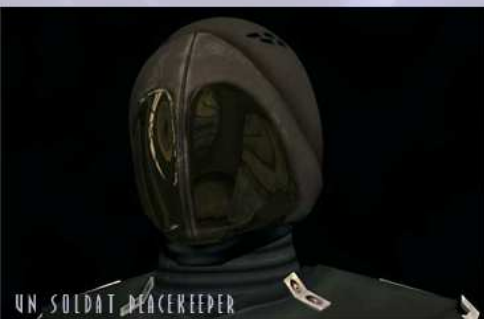
UN SOLDAT PEACEKEEPER